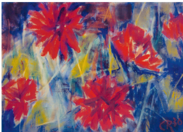
Christian Rohlf's, Rote Dahlien, 1930